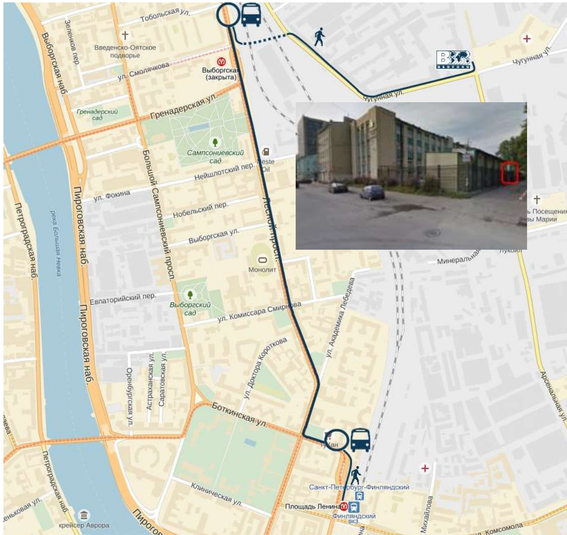
Схема проезда МАРШРУТНЫМ ТАКСИ от метро «Площадь Ленина».