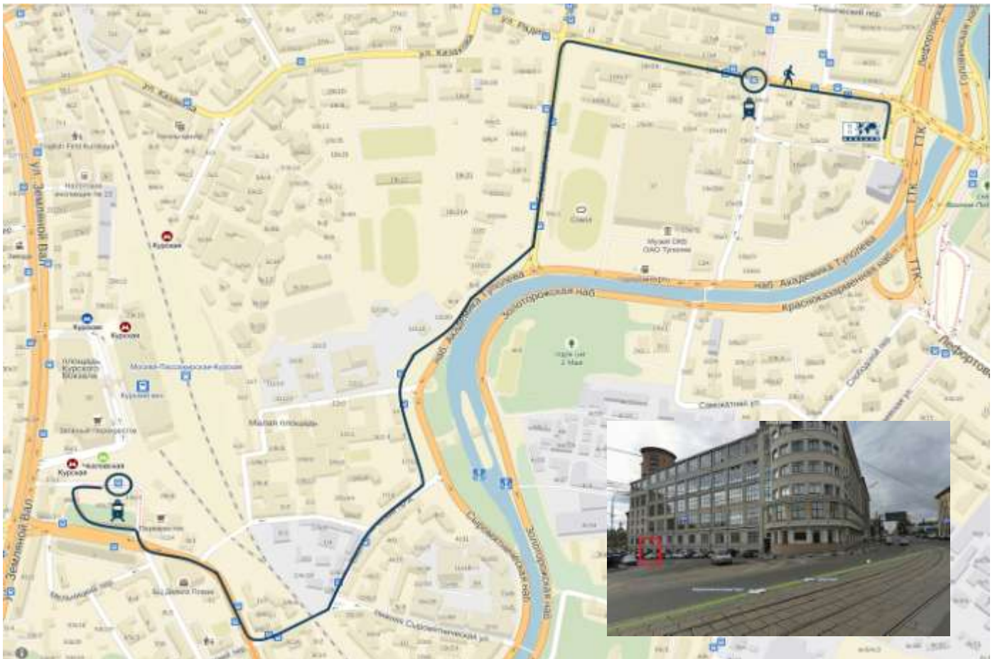
Схема проезда ТРАМВАЕМ от метро «Чкаловская».